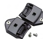
WAC00003 ADAPTER MET BAYONET