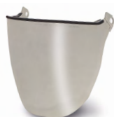
WV100003 VIZIER FULL FACE