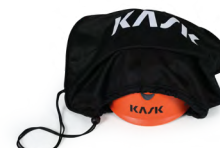
UAC00002 HELM TAS