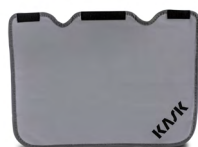
WAC00020 PROTEZIONE NUCALE PER PLASMA