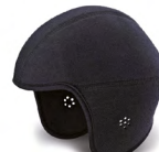
UPA00001 WINTER BINNENWERK